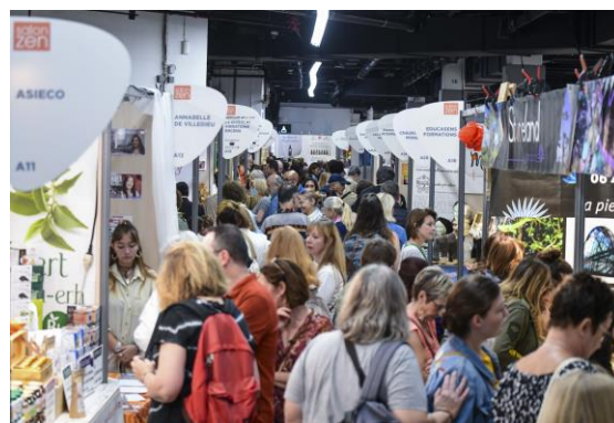
Salon Zen 2023