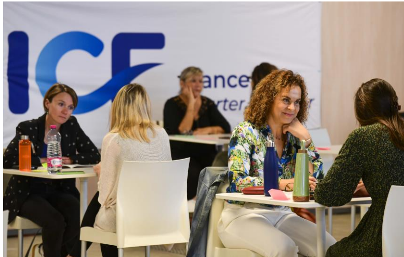
L'espace Speed Coaching au salon Zen 2023.

Un espace d'interviews et d'échanges avec les conférenciers du salon.